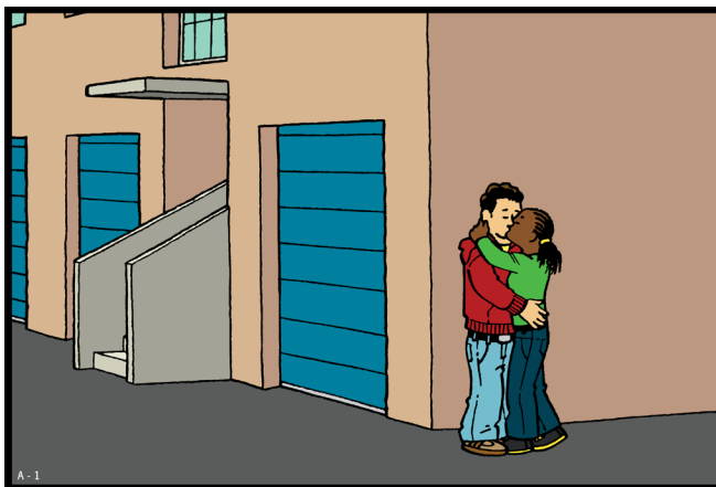
Deze tekening is onderdeel van het lespakket 'Je Lijf, Je Lief'. Zie www.seksueelgeweld.info