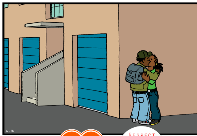
Deze tekening is onderdeel van het lespakket 'Je Lijf, Je Lief'. Zie www.seksueelgeweld.info