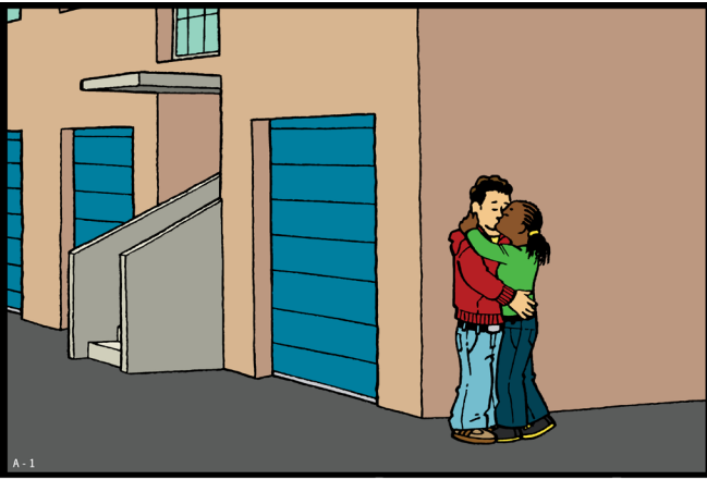
Deze tekening is onderdeel van het lespakket 'Je Lijf, Je Lief'. Zie www.seksueelgeweld.info