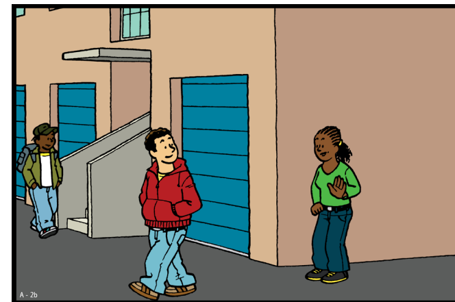
Deze tekening is onderdeel van het lespakket 'Je Lijf, Je Lief'. Zie www.seksueelgeweld.info