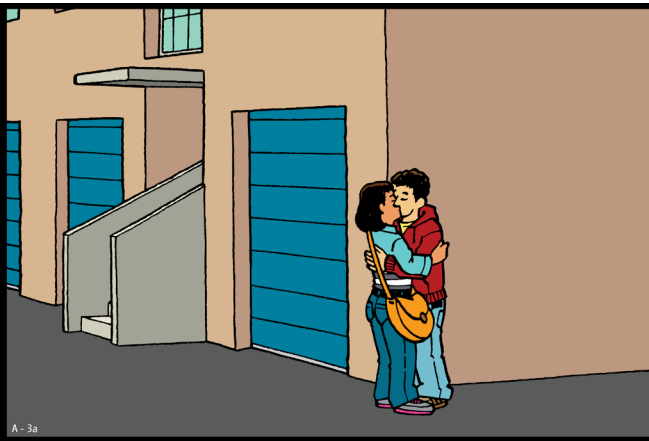
Deze tekening is onderdeel van het lespakket 'Je Lijf, Je Lief'. Zie www.seksueelgeweld.info